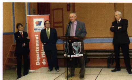
Inauguration de l'école de Lunas