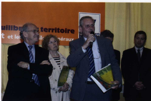
Remise de prix au concours des villages fleuris